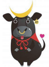
全共宮城大会 マスコットキャラクター 牛政宗(うしまさむね)