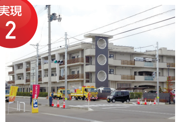
県道塩釜巨理線 岩沼市恵み野町内信号機