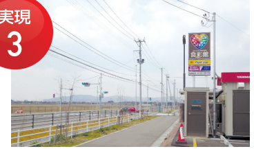
県道海浜緑地線 岩沼市玉浦西信号機