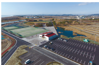
6年ぶりに再開された県立都市公園岩沼海浜緑地 (野球場・テニスコート・避難築山)

仙台湾海浜の恵まれた自然環境を活用し、健全な野外レクリエーションの場として整備された緑地で、多くの県民の方々が訪れる人気のスポットとなっておりますが東日本大震災の津波により壊滅的な被害を受けました。復旧事業として公園利用者が安全・安心に利用できる公園とするため、早期避難を可能とする避難路や、津波襲来時の一時避難場所となる避難築山などの防災施設も併せて整備をしております。