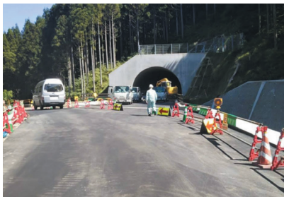
令和元年12月中旬供用開始に向けて工事も大詰めです。(村田町側)