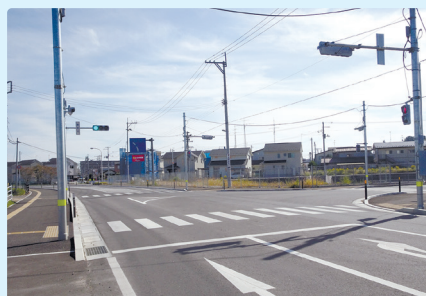
① あさひ野1丁目交差点