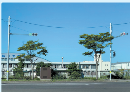
④ 県道仙台空港線臨空工業団地東入口交差点