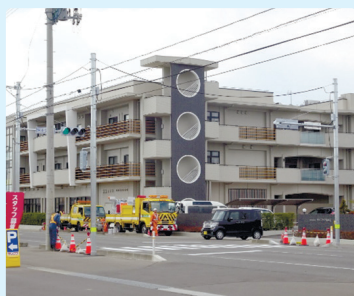
③ 恵み野1・2丁目交差点