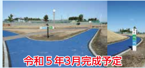
令和5年3月完成予定

400m、1,000m、1,500mのウレタン系弾性舗装を3コース整備。市民の健康増進に繋がります。