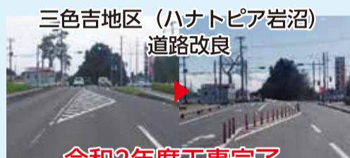
三色吉地区 (ハナトピア岩沼) 道路改良