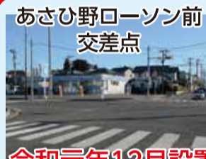
あさひ野ローソン前 交差点