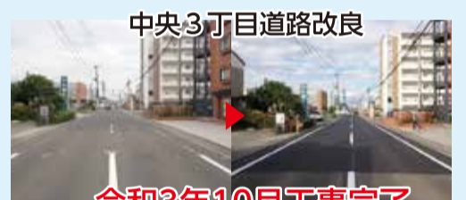
中央3丁目道路改良