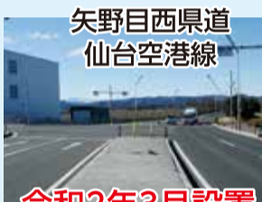
矢野目西県道 仙台空港線