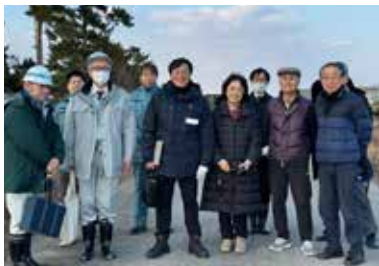
五間堀川（貞山運河）の河川管理に対して要望。