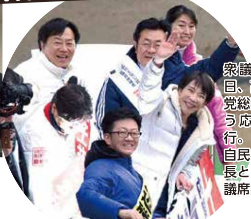
衆議院選挙公示目、高市早苗自民党総裁の来仙に伴う応援演説に同行。自民党県連広報部長として宮城県7議席獲得に貢献。