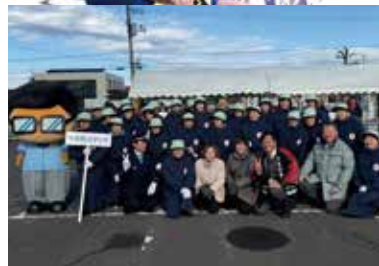
岩沼市女性防火クラブの皆さんと。