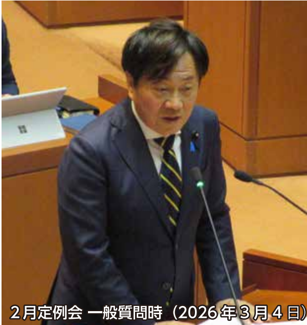
2月定例会 一般質問時 (2026年3月4日)