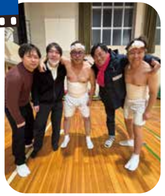
岩沼市商工会青年部の裸参りへ。