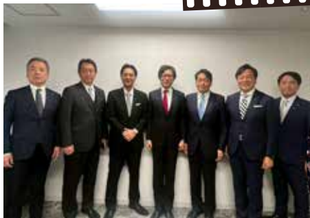
「建国記念の日を祝う宮城県民大会」実行委員長として大会成功に導く。講師の竹田恒泰氏と。